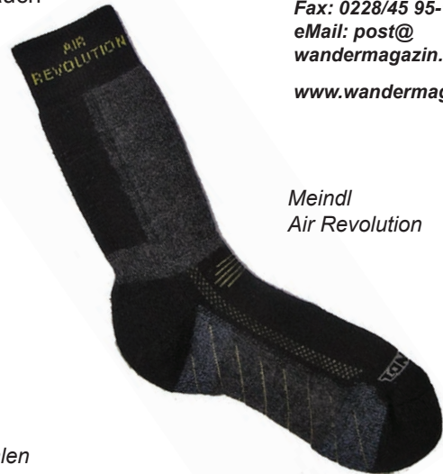
Meindl Air Revolution