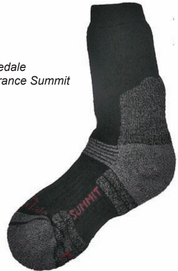
Bridgedale Endurance Summit