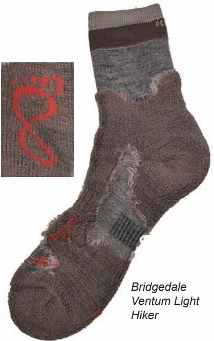
Bridgedale Ventum Light Hiker

Die Air revolution Socke von Meindl setzt zwei verschiedene Naturmaterialien in der Mischung 26% Wolle und 10% Baumwolle ein. Etwa 50% Polyester und knapp ein Zehntel Nylon ergänzen den Materialmix.