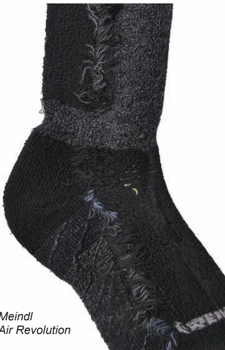
Meindl Air Revolution

Alle drei Testmodelle sitzen gut und sind mit nicht rutschenden Bündchen ausgestattet, die aber in keiner Weise einschneiden oder abschnürren.