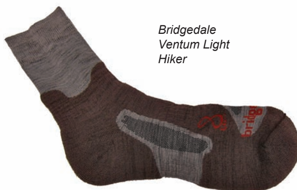
Bridgedale Ventum Light Hiker

In der Praxis haben sich alle Socken gut bewährt. Natürlich sieht man den Socken nach etlichen Wanderkilometern an, wo die Belastungen groß sind, aber auch nach einigen hundert Kilometern sorgen alle getesteten Socken noch für das richtige Klima im Schuh und geben ausreichend Schutz.