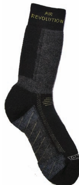
Meindl Air Revolution

Allerdings empfehlen wir diese Möglichkeit nicht ständig auszunutzen und auf Dauer alle Wandersocken, wenn möglich, besser auf der Leine zu trocknen, da dies deutlich schonender für das Material ist.