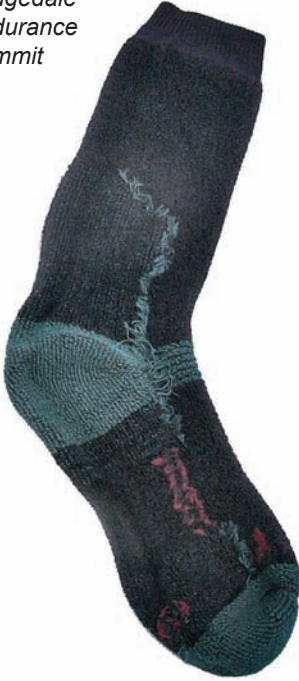
Bridgedale Endurance Summit