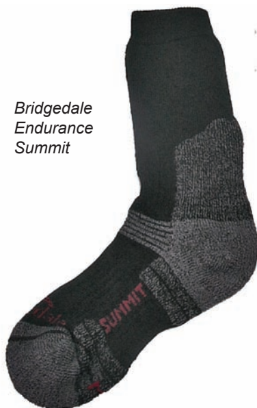
Bridgedale Endurance Summit

Der Endurance Summit von Bridgedale hat auch bei kalten Winterwanderungen (einschließlich Schneeschuhtouren) immer für warme Füßen gesorgt. An wärmeren oder heißen Sommertagen dürfte dieser Socken allerdings etwas zu warm werden. Zu beachten ist auch, dass die Socken recht dick sind und man daher ausreichend Freiraum in den Schuhen benötigt. Die v.a. in der Handwäsche ziemlich langen Trocknungszeiten müssen bei Planung für längere Wanderurlaube (mehr Socken mitnehmen?) entsprechend berücksichtigt werden.