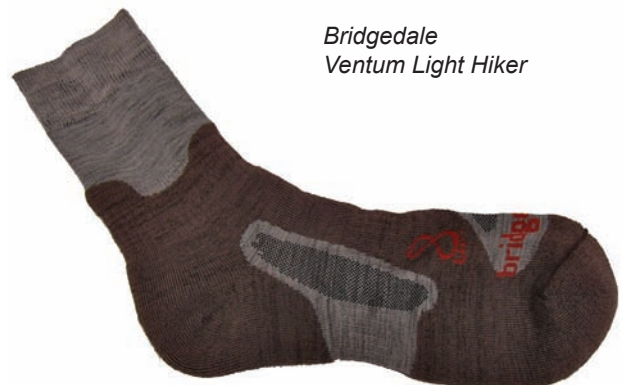
Bridgedale Ventum Light Hiker