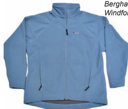
Berghaus Windfoil Jacket