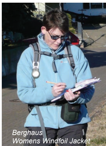
Berghaus Womens Windfoil Jacket

Die Salewa Laxo PL Jacke zeichnet sich ebenso wie die Patagonia R2 durch maximale Flauschigkeit und Weichheit aus. Da beide Jacken als reine Isolierungsschicht konzipiert sind, steht die Wärmespeicherung mit dickem Fleecepolster hier klar im Vordergrund.