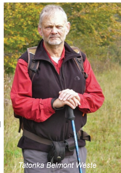
Tatonka Belmont Weste

In punkto Wärmeisolierung verhält sich die R2 Jacke von Patagonia sehr ähnlich. Das Leichtgewicht unter den Testprodukten sorgt zuverlässig für Wärme, liegt eng am Körper und eignet sich dadurch prima als Zwischenschicht an kalten Tagen. Besonders der weiche, eng schließende Kragen trägt zum Wohlbefinden an kalten Tagen bei.