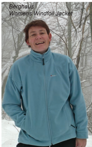
Berghaus Womens Windfoil Jacket

Die Tatonka Belmont Vest hat uns ebenfalls prima vor dem Wind geschützt. Mit der Weste haben wir uns v.a. an etwas wärmeren aber sehr windigen Tagen bestens angezogen gefühlt. Durch die körperliche Aktivität beim Wandern müssen die Arme nicht übermäßig warm gehalten werden und die Weste sorgt für angenehme Körpertemperaturen in den empfindlichen Brust- und Rückenpartien und verhindert das Auskühlen durch den Windchill Effekt.