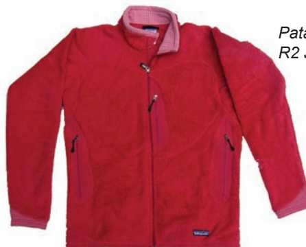
Patagonia R2 Jacket