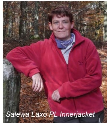
Salewa Laxo PL Innerjacket

Resumé: der Markt ist auch bei Fleeceprodukten riesig geworden und es lohnt sich die eigenen Anforderungen genau zu definieren, bevor es ans Einkaufen geht!