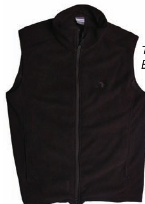
Tatonka Belmont Weste