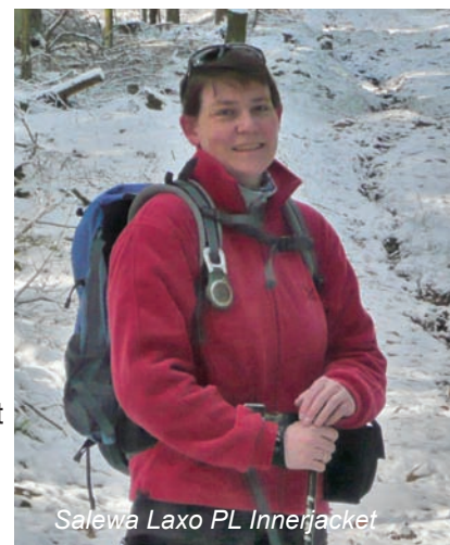
Salewa Laxo PL Innerjacket

W&A Marketing & Verlag GmbH Wandermagazin