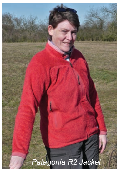
Patagonia R2 Jacket