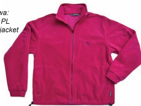
Salewa: Laxo PL Innerjacket