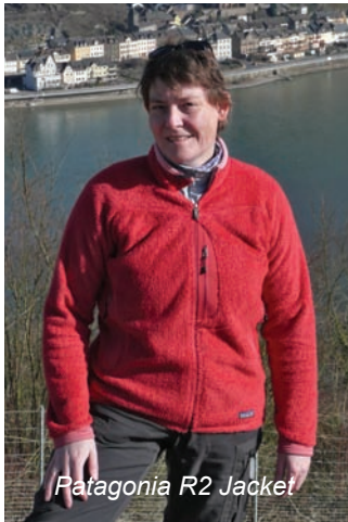
Patagonia R2 Jacket

Rein äußerlich sind sowohl die Tatonka Belmont Weste als auch das Berghaus Windfoil Jacket angenehm weich.