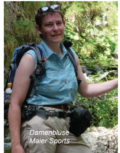
Damenbluse Maier Sports