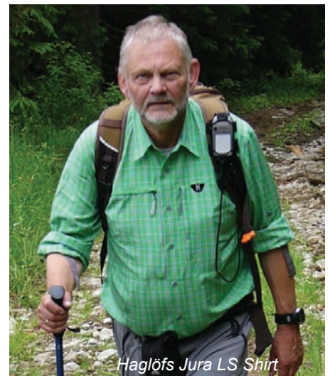
Haglöfs Jura LS Shirt