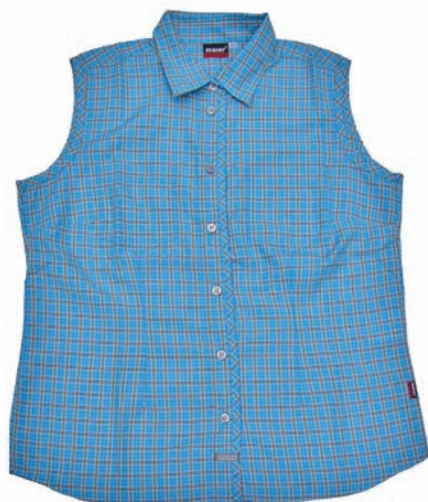
Maier Sports Damenbluse