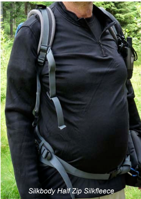
Silkbody Half Zip Silkfleece

In der Praxis haben sich alle sechs Testshirts sehr gut bewährt. Wenn es um schlichte Wärmezufuhr ging, hat uns das W's Micro Jacket von Mountain Equipment sehr gute Dienste geleistet. Kuscheliger warm, durch die Jackenform universell einsetzbar ist diese klassische Fleecejacke als Isolationsschicht unter einer dünnen Regenjacke ideal. Windschutz gibt es naturgemäß nicht. Sehr praktisch sind die beiden RV Taschen. Ebenfalls als perfekte Mittelschicht haben sich die Craft Basic Pearl Polo Shirts bewährt. Auch hier ist hoher Tragekomfort und sehr gute Wärmeregulierung Programm. Als Baselayer sind die Shirts zu dick, aber als 2. Schicht nach der Funktionswäsche tragen sie vorbildlich zum Funktionieren des Zwiebschalenprinzips bei.