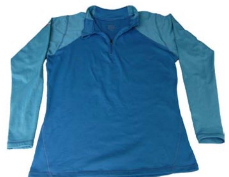
Marmot Midweight L/S Zip Neck Shirt