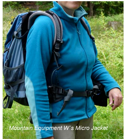
Mountain Equipment W's Micro Jacket

Berechnet man wie viel Wasser die jeweiligen Kleidungsstücke im Verhältnis zu ihrem Trockengewicht aufgenommen haben, so schneidet klar das SmartWool® Shirt mit einem Faktor von 0.94 am besten ab. Es folgt das Silkbody Seidenfleece mit einem Wert von 1.50. Bei den Kunstfaserprodukten wird mit Zahlen von 1.70 und 1.76 bei den beiden Craft Shirts und einem Faktor von 2.0 bei der Mountain Equipment Jacke klar, dass die Polyesterfasern mehr Wasser aufnehmen, es aber relativ schnell wieder abgeben. Am meisten Wasser nimmt das Leichtgewicht im Test, das Marmot Shirt mit einem Faktor von 2.3 auf. Allerdings hängen die hohen Faktoren bei den Craft Basic Pearl Polo Shirts und dem Midweight L/S Zip Neck Shirt auch mit der Struktur zusammen, die sich dann bei diesen Shirts aufgrund der Luftpolster und Rippeln nicht so gut ausdrücken lässt, wie glatte Stoffe.