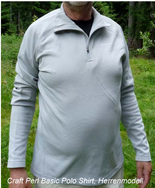
Craft Pearl Basic Polo Shirt, Herrenmodell