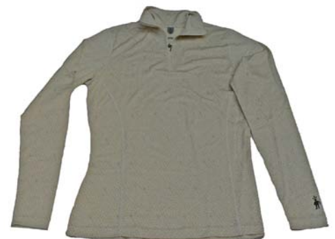
SmartWool® Lightweight Zip-T