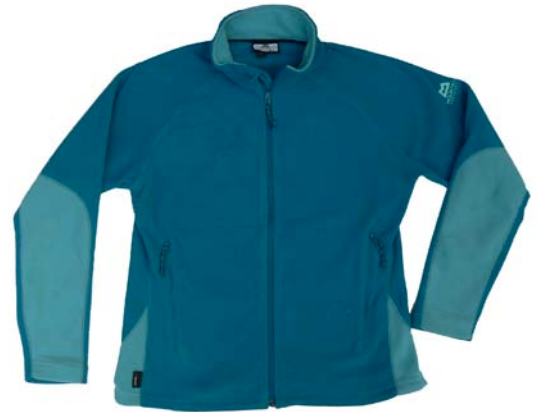
Mountain Equipment W's Micro Jacket

Material: Polartec® 100er Microfleece aus 100% Polyester Pflege: Maschinenwäsche bis max. 40°C, Trocknernutzung möglich Gewicht (L): 280 g Ladenpreis: 79,90 € www.mountain-equipment.de