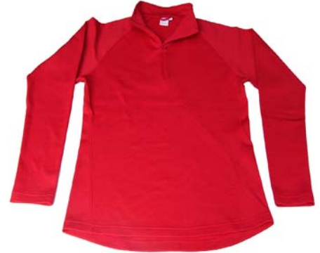
Craft Perl Basic Polo Shirt, Damenmodell