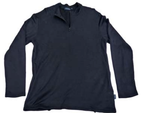
Silkbody Half Zip Silkfleece