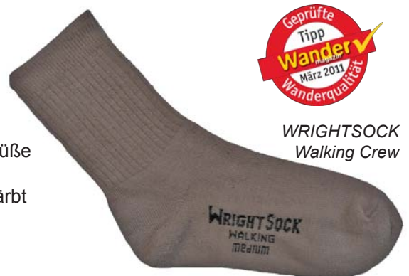
WRIGHTSOCK Walking Crew

Men (M) Gewicht / Paar: 72 g Ladenpreis: 16,50 € Woman (M): Gewicht / Paar: 64 g Ladenpreis: 16,50 € www.wrightsock.de