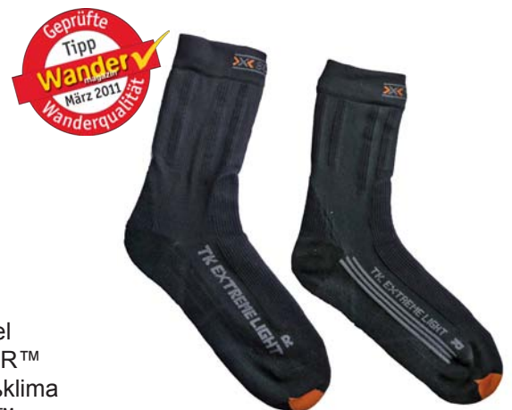
X-SOCKS® Trekking Extreme Light (links: Men, rechts Lady)

Men (S) Gewicht / Paar: 54 g Ladenpreis: 17,95 € Woman (S): Gewicht / Paar: 44 g Ladenpreis: 17,95 € www.x-socks.com