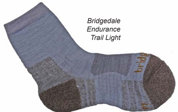
Bridgedale Endurance Trail Light