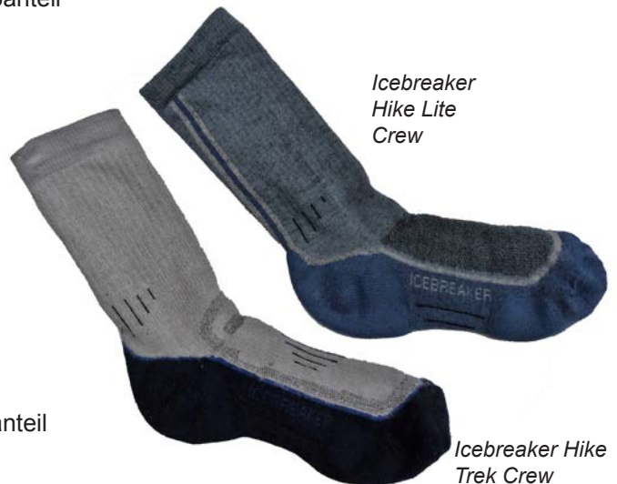
Icebreaker Hike Lite Crew