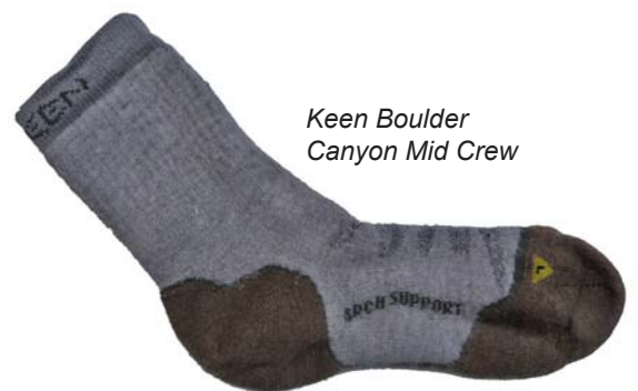
Keen Boulder Canyon Mid Crew