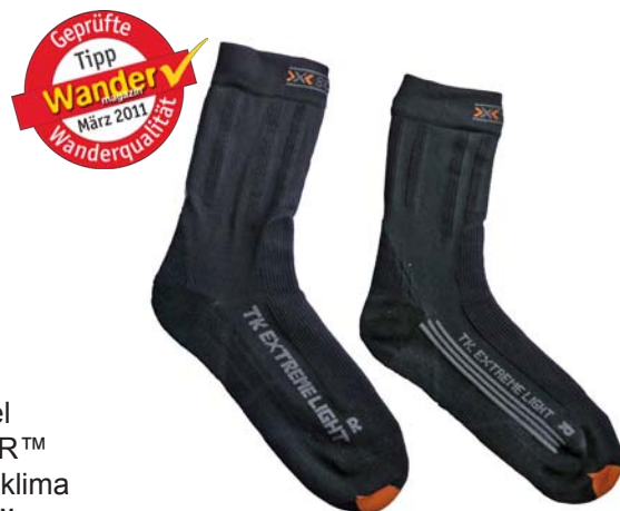
X-SOCKS® Trekking Extreme Light (links: Men, rechts Lady)

Men (S) Gewicht / Paar: 54 g Ladenpreis: 17,95 € Woman (S): Gewicht / Paar: 44 g Ladenpreis: 17,95 € www.x-socks.com