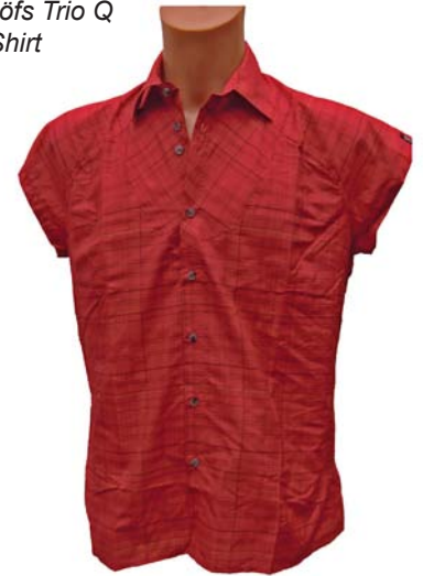
Haglöfs Trio Q SS Shirt

Material: 55% recyceltes Polyester, 45% Polyamid Pflege: Maschinenwäsche bis max. 40°C, kein Weichspüler, kühle Trocknernutzung Gewicht (XL): 66 g Ladenpreis: 60,00 € www.haglofs.se