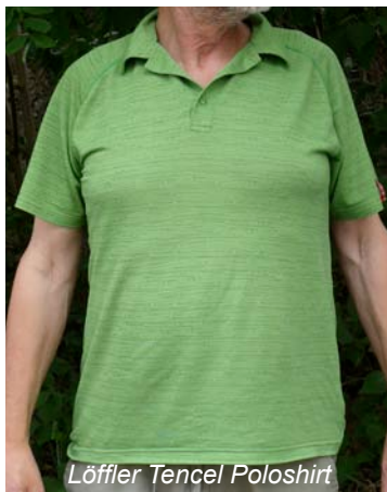
Löffler Tencel Poloshirt

Ebenfalls zu den Sommerkandidaten gehört das Haglöfs Trio Q SS Shirt für Damen. Die Bluse besticht durch ihr federleichtes Gewicht und das extrem kleine Packmaß. Die kurzen Ärmel im Raglanschnitt und der Kragen schützen vor Sonne. Die Bluse ist an der rechten Seitennaht mit einer kleinen, versteckten RV-Tasche (9x11 cm) ausgestattet, in der z.B. der Schlüssel sicher verstaut werden kann. Dank Polygiene® Silbersalztechnik, ist das Gewebe geruchshemmend, die Entstehung von unangenehmem Schweißgeruch wird wirkungsvoll verzögert. Die Bluse besteht aus sehr dünnem Kunstfasermix, wobei 55% recyceltes Polyester verwendet werden. Trotz der geringe Materialstärke ist ein UV-Schutzfaktor von 30+ gewährleistet.