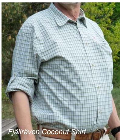
Fjällräven Coconut Shirt

Das Coconut Shirt von Fjällräven für Herren ist bei kühlen Bedingungen ein bestens geeigneter Kandidat. Es zeichnet sich durch hohen Tragekomfort und große Bewegungsfreiheit aus und kommt im klassischen Design eines Wanderhemdes daher. 2 große RV-Taschen, eine davon in die Seitennaht integriert, geben Stauraum für notwendige Kleinigkeiten, bieten aber auch ausreichend Platz für z.B. ein Brillenetui. Wenn es auf der Tour dann doch etwas wärmer wird, lassen sich die Ärmel hochrollen und per Fixierlasche in Position halten. Das sehr pflegeleichte Gewebegemisch aus Polyester und Viskose nimmt überschüssige Feuchtigkeit effektiv auf und gibt sie rasch nach aussen weiter.