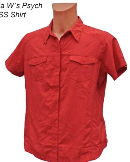
Columbia W's Psych to Hike SS Shirt

Material: 100% Nylon Pflege: Maschinenwäsche bis 30°C, kein Weichspüler, kühle Trocknernetzung Gewicht (XL): 160 g Ladenpreis: 54,95 € www.columbia.com