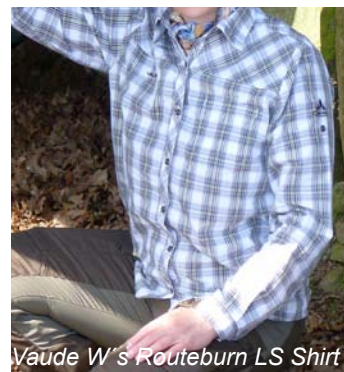
Vaude W's Routeburn LS Shirt

Ein wichtiger Punkt ist besonders im Sommer die Geruchsentwicklung bei Outdooraktivitäten. Erfreulicherweise entwickelten alle Produkte im Testzeitraum nur mäßigen Schweißgeruch beim Wandern im Mittelgebirge. Hier scheinen also sowohl die natürliche Geruchshemmung von Cocona® ( Mounatin Equipment ) oder Tencel® ( Löffler, Vaude ) als auch die Blockade des Bakterienwachstums über Silbersalz ( Haglöfs ) innerhalb der gegebenen Grenzen zu funktionieren.