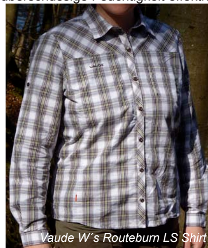
Vaude W's Routeburn LS Shirt

angenehm weich und glatt an. Die auf Cellulosebasis hergestellte Lyocellfaser saugt Flüssigkeit rasch auf, gibt diese aber im Gegensatz zu Baumwolle auch wieder zügig nach aussen ab. Zugleich sorgt der Naturfaseranteil für eine natürliche Geruchshemmung. Die Bluse hat eine kleine offene Brusttasche (10x10 cm). Fixierlaschen mit Knopf sorgen bei aufgerollten Ärmeln dafür, dass alles an Ort und Stelle bleibt.