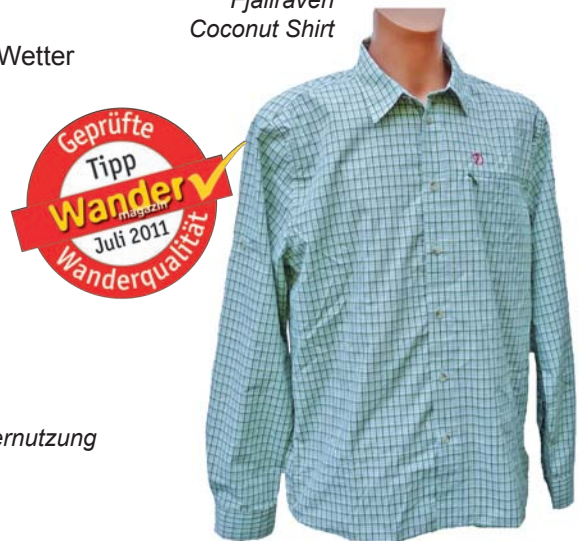
Fjällräven Coconut Shirt

Material: 49% Polyester, 51% Viskose Pflege: Maschinenwäsche bis max. 40°C, kein Weichspüler, keine Trocknernetzung Gewicht (XL): 332 g Ladenpreis: 69,95 € www.fjallraven.de