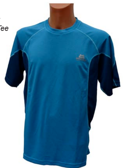
Mountain Equipment M's Crux Tee

Material: 50% recyceltes Polyester, 50% Cocona® Polyester Pflege: Maschinenwäsche bis 40°C, kein Weichspüler, kühle Trocknernutzung Gewicht (XL): 157 g Ladenpreis: 39,95 € www.mountain-equipment.co.uk