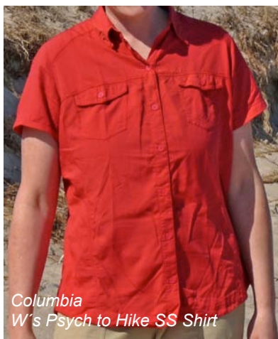
Columbia W's Psych to Hike SS Shirt

Steigen die Temperaturen werden Langarmhemden oder-blusen rasch zu warm. Dann schlägt die Stunde der kurzärmeligen Kandidaten.