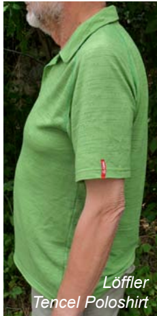
Löffler Tencel Poloshirt