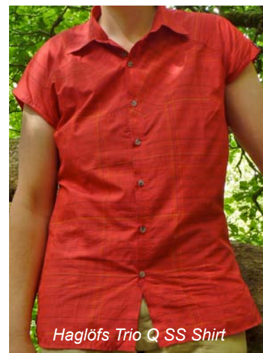
Haglöfs Trio Q SS Shirt

Das Tencel Poloshirt von Löffler (für Damen und Herren erhältlich, als Herrenmodell getestet), nutzt die Vorteile der neuen Cellulosefaser Tencel® in Verbindung mit Polyester. Das Ergebnis ist ein superweiches, sehr anschmiegsames und kühl auf der Haut liegendes Poloshirt, das vorne mit 3 Knöpfen geschlossen werden kann. Die Kombination der beiden Materialien sorgt für ein sehr effektives Feuchtigkeitsmanagement.