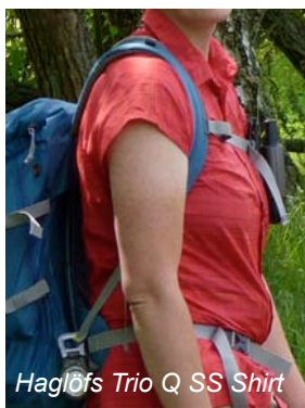
Haglöfs Trio Q SS Shirt

Wie sieht es nun konkret mit dem UV-Schutz der Testprodukte aus?