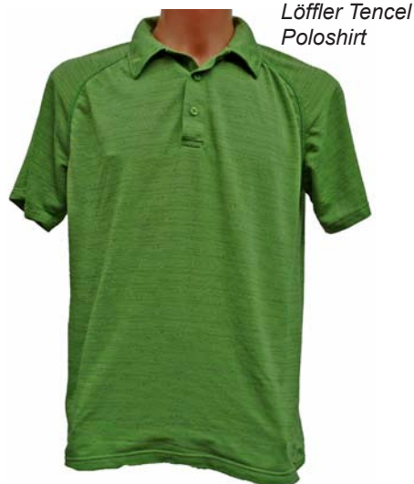
Löffler Tencel Poloshirt