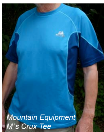
Mountain Equipment M's Crux Tee

Was die Ausstattung betrifft, so bieten naturgemäß die einfach geschnittenen Shirts von Mountain Equipment und Löffler keine bewertbaren Zusatzeigenschaften. Das Herrenhemd von Fjällräven ist dagegen mit 2 RV-Taschen ausgestattet, die in ihren Abmessungen auch so großzügig ausgelegt sind, dass man z.B. eine Brille gut und sicher unterbringen kann. Bei den Damenmodellen ist dieser Ausstattungspunkt generell kritisch, denn oft sind Blusen zwar mit Taschen versehen, die fallen aber deutlich kleiner als bei den Herren aus. Die Vaude Bluse hat eine offene Tasche, die mit einer Tiefe von 10 cm notfalls für die Sonnenbrille genutzt werden kann. Eine Sicherung gegen das Herausfallen (Knopf oder RV) gibt es aber nicht. Die Columbia Bluse hat zwar zwei Brusttaschen mit Lasche und Knopf, das letztgenannte Problem würde also vermieden werden. Mit einer Tiefe von knapp 9cm hat man aber Mühe eine durchschnittliche