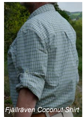
Fjällräven Coconut Shirt

Um zu erkennen, wie gut ein Kleidungsstück gegen UV-Strahlung schützt, sollte man den UPF (oder auf deutsch auch USF = UV-Schutzfaktor) kennen. Auch der ist in Stufen eingeteilt und in erster Linie vom Material abhängig. Ein UPF unter 15 ist nicht ausreichend (Beispiel: Baumwolle hat einen UPF um 10). Ein UPF bis 24 gilt als gut, zwischen 25 und 39 als sehr gut und ein Wert von 40 oder höher als hervorragend. Tatsächlich beschreibt der UPF wie hoch der Anteil der UV-Strahlung ist, die durch die Kleidung dringt. Bei einem Faktor von 40 ist das ein Vierzigstel also 2.5%. In diesem Fall hält das Kleidungsstück also 97.5% der schädlichen Strahlung ab, bzw. ermöglicht es uns 40 mal länger in der Sonne zu Verweilen, bis wir die gleiche Dosis an UV abbekommen haben, wie das ohne Schutz der Fall wäre.