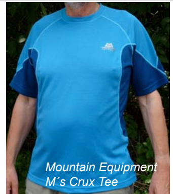
Mountain Equipment M's Crux Tee

Ebenfalls aus einer Mischung aus Kunst- und Naturfaser ist das M's Crux Tee von Mountain Equipment gefertigt. Das kragenlose T-Shirt ist rasch übergezogen und schmiegt sich kühlend und weich an die Haut an. Neben 50% recyceltem Polyester wird hier auch 50% Cocona® Polyester genutzt. Cocona® wird aus Kokosnussschalen gewonnen. Daraus stellt man Aktivkohlefasern her, die mit einem Polyesterfaden zu Cocona® Polyester verarbeitet werden. Dadurch überträgt sich die natürliche geruchshemmende Wirkung der Aktivkohle auf das Endprodukt. Das T-Shirt verfügt über keine zusätzliche Ausstattung.