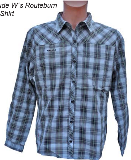
Vaude W's Routeburn LS Shirt

Material: 40% Lyocell (Cellulosefaser Tencel®), 33% Polyester, 27% Baumwolle Pflege: Maschinenwäsche bis 30°C, kein Weichspüler, kühle Trocknernetzung Gewicht (44): 194 g Ladenpreis: 60,00 € www.vaude.com