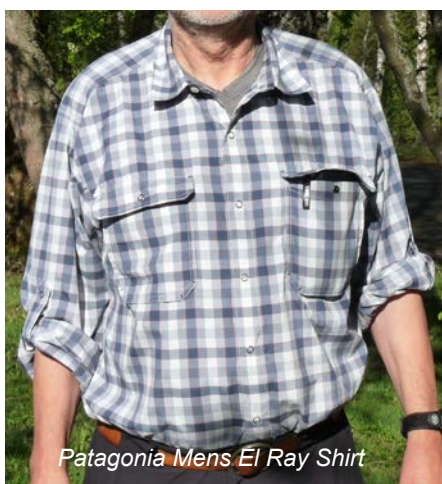
Patagonia Mens El Ray Shirt

Ähnlich sieht es beim Patagonia Mens El Ray Shirt aus, das sich als perfektes Wanderhemd präsentiert. Durch lockeren Schnitt sehr bequem, bietet das Hemd hohen Tragekomfort bei zugleich überzeugender Leistung im Bereich des Feuchtigkeitstransfers. Zwei sehr geräumige Brusttaschen (12 x 14 cm), die mit breiter Abdeckklappe und Druckknopf geschlossen werden können, bieten Platz für Brille etc. Die Ärmel können nach dem Aufrollen per Lasche und Druckknopf fixiert werden. Das Hemd selbst wird, bis auf den obersten Knopf am Kragen, ebenfalls mit Druckknöpfen geschlossen. Übrigens besteht das Hemd zwar zu 100% aus Kunstfaser, 57% davon sind aber recyceltes Polyester.