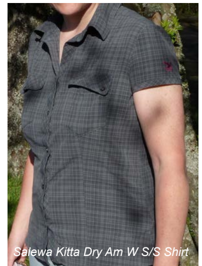
Salewa Kitta Dry Am W S/S Shirt

Ebenfalls in seiner Wirkung auf Mensch und v.a. Umwelt noch nicht voll erfasst ist der Einsatz von insektenabwehrenden Stoffen wie Permethrin in Outdoorbekleidung. Im Test ist die Salewa Bluse zur aktiven Insektenabwehr mit der HHL Technology™ Vital Protection Imprägnierung versehen. Bei der etwas mühsamen Recherche (bei Salewa gibt es keinerlei weiterführende Informationen zu diesem Thema) haben wir herausgefunden, dass diese Technik tatsächlich den synthetisierten Stoff Permethrin nutzt (ursprünglich ist Permethrin ein pflanzlicher Wirkstoff der in Chrysanthemen vorkommt und als Insektizid genutzt wird). Was Permethrin in Textilien betrifft, so ist v.a. die Auswaschbarkeit und damit die Belastung der Gewässer noch nicht komplett untersucht und geklärt. Daher sollte man auch bei dieser Zusatzausstattung überlegen, ob sie in unseren Breiten wirklich notwendig ist. Bei einer Reise in die Tropen, wo durch Insektenstiche und -bisse schwerwiegende Krankheiten übertragen werden können, sieht das etwas anders aus, als bei der Wanderung durch den heimischen Wald, wo v.a. Krankheiten durch Zeckenbisse gefährlich werden können, gegen die aber am effektivsten z.B. lange, unten geschlossene Hosenbeine wirken oder gegen die es zumindest bei FSME auch eine wirksame Impfung gibt.