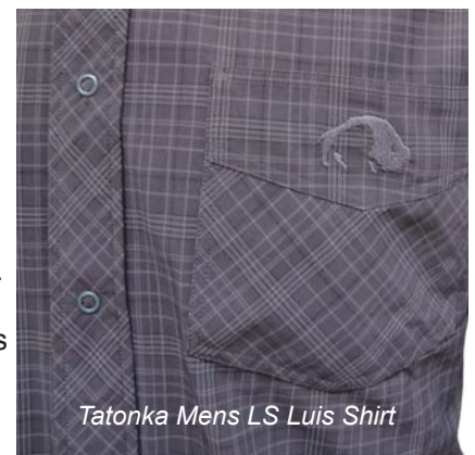
Tatonka Mens LS Luis Shirt

Aufgrund der aufgezählten kleinen Schwächen, erhält daher das Tatonka Hemd ebenfalls kein Testsiegel.