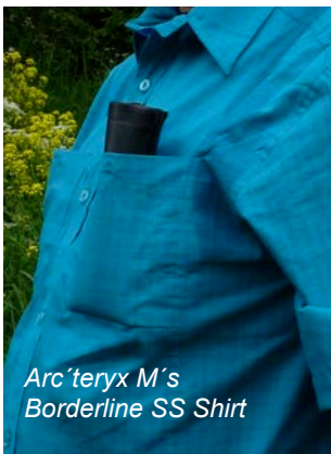
Arc'teryx M's Borderline SS Shirt

Das dritte Kurzarmmodell, das Arc'teryx Borderline Short Sleeve Shirt für Herren bietet als einziges der 3 Kurzarmmodelle ein zumindest teilweise natürliches Gewebe. Die Mischung aus Baumwolle und Mais basierendem Polyester (VERDI™) hat sich trotz des sehr hohen Baumwollanteils überraschend gut bewährt. Sowohl der Feuchtttransfer, als auch die Trocknungszeit (beides bei reiner Baumwolle absolute Ausschlusskriterien für die Tauglichkeit im Outdoorbereich) sind so gut, dass dieses Shirt absolut zu Recht in der Kategorie „Funktionskleidung“ eingeordnet ist. Leider verzichtet der Hersteller auf die Angaben zum UV-Schutz, der uns interessiert hätte, denn Baumwolle schneidet bei diesem Thema deutlich schlechter ab als die Kunstfasern. Auch die Taschenausstattung ist für ein Reise- und Outdoorherrenhemd nicht optimal. Es gibt zwar 2 Taschen, die aber beide nicht besonders tief sind. Somit läuft man Gefahr beim Bücken den Tascheninhalt zu verlieren. Ebenfalls nicht optimal sind die Pflegeeigenschaften: Stichwort Knittern! Daher gibt es auch für diesen Kandidaten nicht das begehrte Testsiegel.