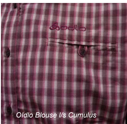
Oldo Blouse I/s Cumulus

Der nächste Testkandidat ist die Oldo Blouse I/s Cumulus . Diese Bluse lässt fast keinen Wunsch offen. Der lockere Schnitt und das angenehm weiche Material sorgen für hohen Tragekomfort und gute Bewegungsfreiheit. Lediglich die Ärmel fallen etwas eng aus, was sich beim Hochkrempeln bemerkbar macht. Absolut überzeugend sind die Trage- und Pflegeeigenschaften der Bluse, die perfekten Feuchtttransfer und perfekten UV-Schutz (USF 50!) bietet und sehr rasch trocknet.