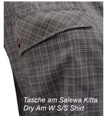
Tasche am Salewa Kitta Dry Am W S/S Shirt

Feuchtttransfer überzeugen rund um, die Taschen dagegen nicht wirklich. In den (wie bei Damenmodellen meist üblich) eher knapp bemessenen Taschen ragt beispielsweise eine Sonnenbrille in den Bereich der Abdecklasche. Da die Lasche nur einseitig geknöpft wird, fällt beim Bücken der Tascheninhalt schnell unbemerkt heraus. Ohne Gefahr zu laufen, etwas zu verlieren, kann man die Taschen also leider nur bei aufrechtem Gang nutzen. Was die Angaben zum Material betrifft, so ist es auch bei diesem Modell unverständlich, dass sich der Hersteller nicht die Mühe macht, den UV-Schutz des Materials (der durchaus vorhanden ist) anzugeben. Da die Bluse zudem das noch nicht gänzlich in seiner Auswirkung erforschte Permethrin nutzt (auch diese Angabe wäre gut gewesen), sehen wir von einer Siegelvergabe an dieses Modell (wie auch an das Langarm-Pendant, das wir ebenfalls im Test hatten) ab.