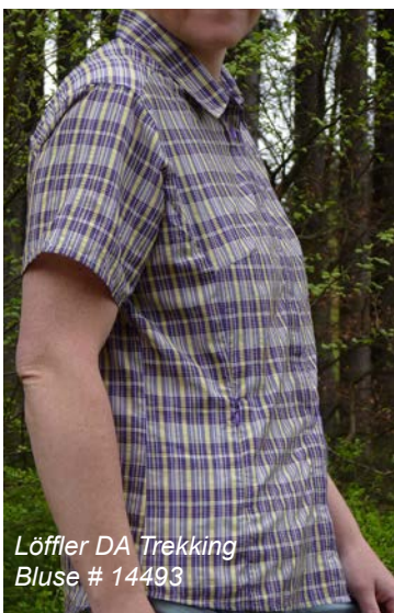
Löffler DA Trekking Bluse # 14493

Wie haben sich die Testkandidaten nun in der Praxis bewährt? Wo liegen die Stärken, wo die Schwächen? Widmen wir uns zunächst den Kurzarmmodellen.