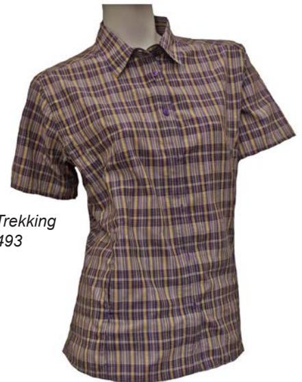
Löffler DA Trekking Bluse # 14493