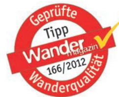
Patagonia Mens El Ray Shirt