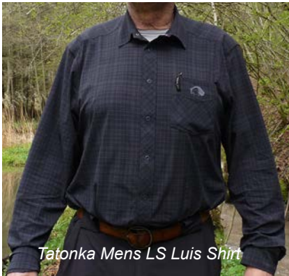
Tatonka Mens LS Luis Shirt

Das Tatonka Mens LS Luis Shirt rundet als leichtes und sehr bequemes Wanderhemd das Feld der Testkandidaten ab. Dank des hohen Elasthananteils dehnt sich der Stoff fast unbegrenzt und optimiert dadurch den Tragekomfort auf ein Maximum. Das Kunstfasermaterial liegt glatt und kühlend mit sehr überzeugender Haptik auf der Haut. Das Hemd bietet eine nach oben offene 11 x 11 cm große Brusttasche. Leider gibt es, entgegen der Angaben im Katalog, keine Fixierlaschen für die aufgerollten Ärmel. Das Hemd ist mit einer Polygiene Ausrüstung zur Geruchshemmung ausgestattet. Die Knopfleiste ist durchgehend mit Druckknöpfen bestückt.