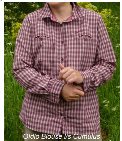
Odlo Bluse l/s Cumulus

Im Test weist die Odlo Bluse mit einem exzellenten Faktor von 50+ den besten Sonnenschutz auf. Ausgezeichneten Schutz von 40+ bietet auch das Patagonia Hemd und noch sehr guten Schutz mit 30+ das Tatonka Hemd. Bei den Produkten von Arc'teryx , Löffler und Salewa gibt es keinerlei Kennzeichnung und Angabe zum UV-Schutzfaktor, was bei der abschließenden Bewertung und Siegelvergabe negativ zu Buche schlägt.