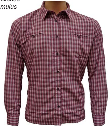
Odlo Blouse I/s Cumulus