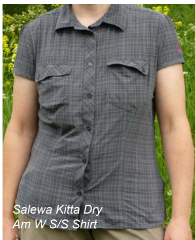
Salewa Kitta Dry Am W S/S Shirt

Dank guten Feuchtetransfers ist das Salewa Kitta Dry Am W S/S Shirt ideal für heiße Sommertage. Es bietet durch das dehnbare Kunstfasermaterial mit 15% Elasthananteil schier unbegrenzte Bewegungsfreiheit und eine sehr angenehme, kühlende Haptik. Insektenschutz und Geruchshemmung werden durch eine Imprägnierung (HHL Technology™ Vital Protection) erreicht. Die sehr rasch trocknende Bluse hat zwei Brusttaschen (11 x 11 cm) mit einfach geknöpften Abdeckklappen. Übrigens: mit dem Modell Fianit Dry Am W L/S Shirt bietet Salewa eine 10 € teurere Langarmvariante dieser Kurzarmbluse mit nahezu identischen Eigenschaften an.