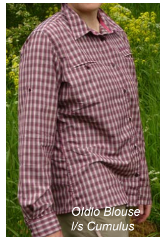
Odlo Blouse l/s Cumulus

Bei den Langarmmodellen bietet die Odlo Blouse l/s Cumulus alle Eigenschaften, die man von einer bequemen Wanderbluse erwartet: gute Bewegungsfreiheit, sehr angenehme Haptik des 100% Kunstfasermaterials, gutes Feuchtigkeitsmanagement und hervorragenden Sonnenschutz. Zudem ist das Material geruchshemmend ausgestattet. Die Bluse hat 2 Brusttaschen (jeweils 11 x 11 cm) mit Knopf. Im aufgerollten Zustand lassen sich die Ärmel per Lasche und Knopf fixieren.