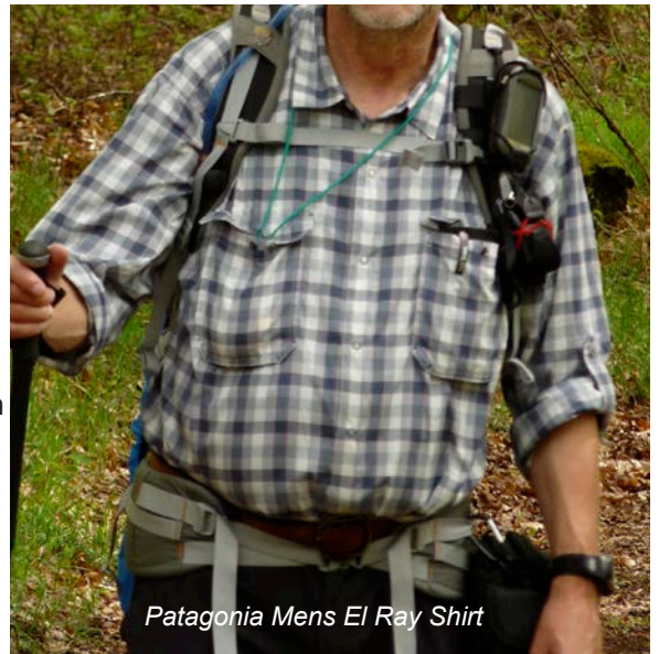
Patagonia Mens El Ray Shirt

Noch ein Wort zum Preis: Die Leistung des Patagonia Hemdes ist mit 70 € ausgewogen taxiert (als Kurzarmvariante kostet es 60 €).