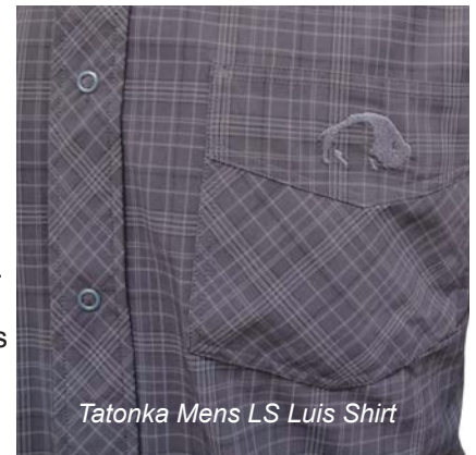
Tatonka Mens LS Luis Shirt

Aufgrund der aufgezählten kleinen Schwächen, erhält daher das Tatonka Hemd ebenfalls kein Testsiegel.