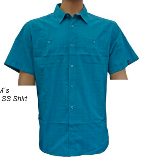
Arc'teryx M's Borderline SS Shirt