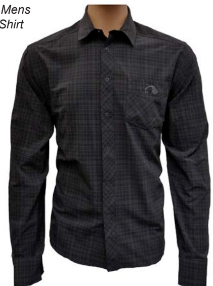
Tatonka Mens LS Luis Shirt