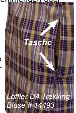
Löffler DA Trekking Bluse # 14493

Was die Ausstattung angeht so ist die in der Seitennaht integrierte Tasche eine gute Lösung. Natürlich wäre die Tasche etwas größer praktischer, aber man kann damit leben und wenigstens das Notwendigste sicher unterbringen. Insgesamt ein solides Produkt mit gutem Preis-Leistungsverhältnis, das aber v.a. aufgrund der fehlenden UV-Angaben kein Testsiegel von uns erhält.