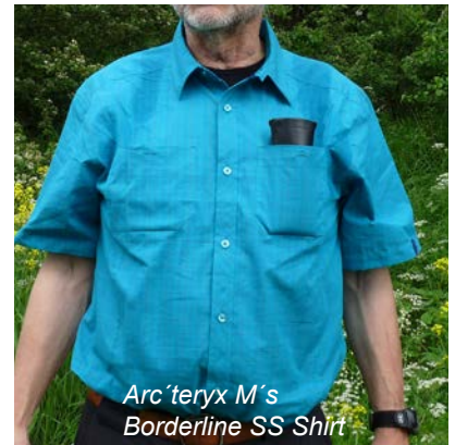
Arc'teryx M's Borderline SS Shirt

Das Arc'teryx M's Borderline SS Shirt präsentiert sich als locker geschnittenes Wander- und Reisehemd mit viel Bewegungsfreiheit. Das innovative VERDI™ Material aus Baumwolle und Polyester auf Maisbasis trägt sich angenehm auf der Haut. Das Hemd ist mit 2 nach oben offenen, jeweils mit einem Knopf zu schließenden Taschen ausgestattet, die 12 x 12 cm groß sind. Trotz des hohen Baumwollanteils trocknet das Hemd ziemlich rasch und speichert auch bei höherem Aktivitätslevel nicht übermäßig viel Feuchtigkeit, sondern gibt diese nach außen ab. Das Borderline Shirt ist übrigens auch als Langarmvariante (dann 10 € teurer) mit identischen Eigenschaften zu haben.