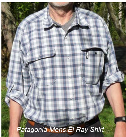
Patagonia Mens El Ray Shirt

Ähnlich sieht es beim Patagonia Mens El Ray Shirt aus, das sich als perfektes Wanderhemd präsentiert. Durch lockeren Schnitt sehr bequem, bietet das Hemd hohen Tragekomfort bei zugleich überzeugender Leistung im Bereich des Feuchtigkeitstransfers. Zwei sehr geräumige Brusttaschen (12 x 14 cm), die mit breiter Abdeckklappe und Druckknopf geschlossen werden können, bieten Platz für Brille etc. Die Ärmel können nach dem Aufrollen per Lasche und Druckknopf fixiert werden. Das Hemd selbst wird, bis auf den obersten Knopf am Kragen, ebenfalls mit Druckknöpfen geschlossen. Übrigens besteht das Hemd zwar zu 100% aus Kunstfaser, 57% davon sind aber recyceltes Polyester.