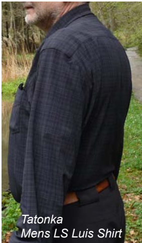
Tatonka Mens LS Luis Shirt

Neben dem Sonnenschutz, sind immer mehr Kleidungsstücke mit meist chemischen Zusatzausstattungen versehen. So bieten die Odlo Bluse mit der „effect“ Faser und das Tatonka Hemd mit der „polygiene“ Ausstattung Technologien, die für eine Hemmung der Geruchsentwicklung sorgen. Das geschieht in beiden Fällen über die Dotierung des Gewebes mit Silber (Ag)-Ionen. Die sind zwar für den Menschen unbedenklich, nicht aber für die auf der Haut angesiedelten Bakterien. Diese sterben durch das Silber ab, es entsteht deutlich weniger unangenehmer Schweißgeruch als bei unbehandelten Geweben. Problematisch könnte der weitgreifende Einsatz der Ag-Ionen-Technologie allerdings auf Dauer für den medizinischen Sektor sein, denn dort werden manche Wunden mit durch Silberionen bakterienhemmenden Verbandsmaterial versorgt. Durch den zunehmenden Einsatz in Outdoorbekleidung wächst die Gefahr von Bakterienresistenzen gegen die Silberionen und im schlimmsten Fall könnte man eine wirkungsvolle Waffe im Kampf gegen Bakterieninfektionen von Wunden verlieren. Daher ist es wichtig, genau abzuwägen, ob und in welchen Outdoorbekleidungsstücken eine solche Ausrüstung wirklich Sinn macht.