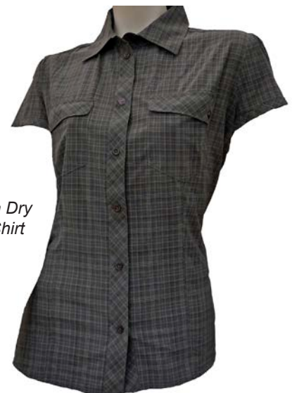
Salewa Kitta Dry Am W S/S Shirt