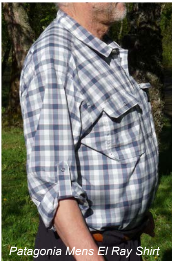
Patagonia Mens El Ray Shirt

Der Standard bei der Klassifizierung der UV-Schutzfaktoren ist übrigens die 1996 definierte australische Norm.