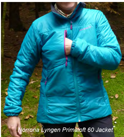
Norrona Lyngen PrimaLoft 60 Jacket

PrimaLoft® Sport kommt auch beim Norrona Lyngen PrimaLoft 60 Jacket zum Einsatz und zwar mit einer Materialstärke von 60g/m 2 . Das trägt zur unglaublichen Leichtgewichtigkeit der Jacke bei, die dennoch eine sehr gute Wärmeleistung bietet. Sie eignet sich besonders gut als Midlayer, kann aber bei geeignetem Wetter auch als äußere Kleidungsschicht zum Einsatz kommen. Die Jacke ist komplett mit PrimaLoft® gefüllt. In den beiden seitlichen RV-Taschen werden kalte Hände rasch wieder warm. Sie können auch bei geschlossenem Rucksackhüftgurt genutzt werden. Wer die Jacke eng verpacken möchte, kann sie in eine dieser Seitentaschen verstauen. Eine zusätzliche RV-Außentasche an der Brust bietet zusätzlichen Stauraum für Kleinigkeiten. Der Kragen schließt angenehm hoch und ist auf der Innenseite mit einem Microfleecefutter belegt, was den Hals zusätzlich warm hält. Der Front-RV ist mit einer 18 mm breiten Innenabdeckleiste hinterlegt. Dadurch kann hier keine Kälte eindringen. Auch an den eng anliegenden elastischen Ärmelbündchen bleibt alles warm. Die Jacke hat keine Kammern, sondern ist nur durch wenige