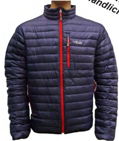
Rab Microlight Jacket

Sehr leichte 90/10er Gänsedaunenjacke mit 750er Füllkraft. Kleine Kammern. Gute Passform und sehr gute Isolation. Sehr kompaktes und kleines Packmaß.