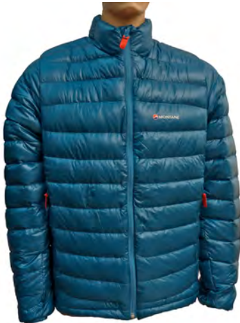
Montane Nitro Jacket

Extrem warme Daunenjacke mit 93/7er Gänsedaunen Mischung und 800er Füllkraft. Sehr gute Isolation. Am Hals gute Passform. Kleines Packmaß und niedriges Gewicht.