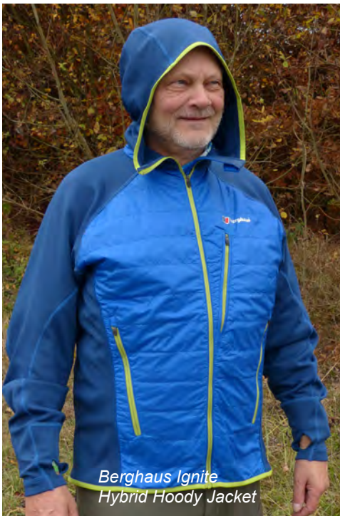
Berghaus Ignite Hybrid Hoody Jacket

Beim Berghaus Ignite Hybrid Hoody Jacket handelt es sich ebenfalls um eine mit PrimaLoft® gefütterte Jacke, allerdings kommt hier die etwas hochwertigere PrimaLoft® One Füllung zum Einsatz. Die von uns getestete Jacke war das Hybridmodell mit Kapuze. Es weist lediglich im Frontbereich und am Rücken PrimaLoft® auf, ansonsten besteht es aus herrlich dehnbarem Stretchgewebe. Allerdings gibt es das Berghaus Ignite Jacket auch als PrimaLoft® Volljacke und auch ohne Kapuze. Die lässt sich leider nicht regulieren, sitzt aber relativ gut, so dass beim Drehen des Kopfes das Gesichtsfeld kaum eingeschränkt wird.