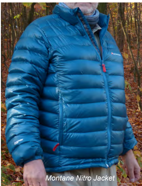
Montane Nitro Jacket

Die dritte Daunenjacke im Test ist das Nitro Jacket von Montane .