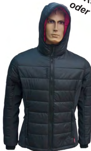
Lafuma Destivelle Jacket

Robuste und relativ dicke Hybrid-PrimaLoft® Jacke mit seitlichen Stretch-Einsätzen. Die PrimaLoftkapuze hält auch den Kopf angenehm warm. Sowohl als Midlayer als auch als äußere Schicht geeignet.