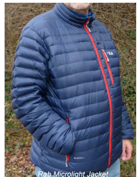
Rab Microlight Jacket

Bei unserem Isolationstest (Erläuterungen siehe Glossar), hat die Rab Jacke innerhalb von 5 Minuten eine Temperaturanstieg von etwa 6 °C zugelassen,