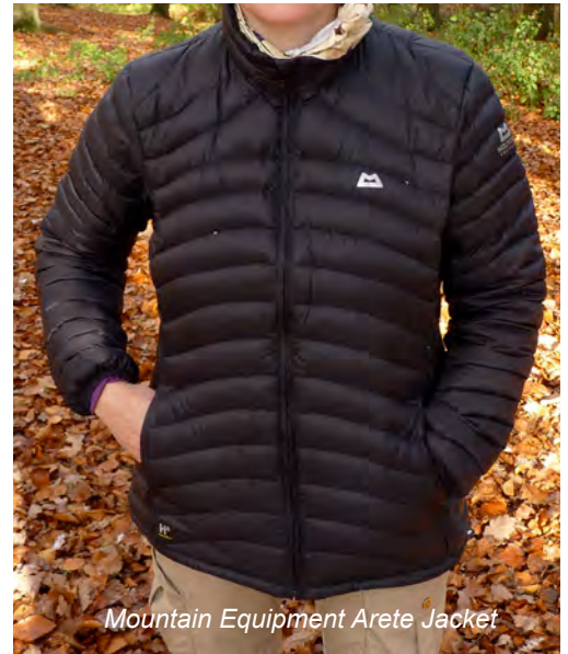
Mountain Equipment Arete Jacket

Dennoch kann das Wandermagazin Testsiegel erdenklich knapp nicht an diese Jacke von Mountain Equipment gehen, da die Montane Jacke in punkto Gewicht, Daunenqualität, fillpower und Isolationsleistung noch etwas besser abschneidet. Wer aber eine preisgünstige und zugleich sehr gut isolierende Jacke sucht und die vorbildliche Transparenz von Mountain Equipment unterstützt, ist mit dem Arete Jacket perfekt bedient.