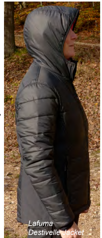
Lafuma Destivelle Jacket

Die erste Testjacke mit PrimaLoft® Füllung ist das Destivelle Jacket von Lafuma . Diese Jacke ist die am dicksten gefütterte Jacke in der PrimaLoft® Kategorie. Dadurch eignet sie sich nicht nur als mittlere Wärmeschicht, sondern bei geeigneter Wetterlage auch als äußerste Kleidungsschicht. Die Ausstattung mit einer Kapuze unterstreicht diesen Einsatzbereich, auch wenn sich die Kapuze leider nicht regulieren lässt und dadurch beim Drehen des Kopfes die Sicht versperrt. Die Jacke bietet 2 seitliche RV-Handwärmetaschen, die man auch bei geschlossenem Rucksackhüftgurt noch gut erreicht. Eine Innentasche vervollständigt die Ausstattung. Als Isolationsfüllung kommt PrimaLoft® Sport zum Einsatz, das in 7 cm breiten Kammern verteilt ist. Allerdings nicht an den Seiten der Jacke, die aus dehnbarem und hoch atmungsaktivem Stretchmaterial gefertigt sind. Die elastischen Ärmelbündchen schließen gut, ohne einzuengen und geben der Kälte keine Chance einzudringen. Dazu trägt auch die 18 mm breite innere Abdeckleiste des Front-RV bei. Beim Isolationstest ergab sich eine durchschnittliche Erwärmung um 7.5°C. Damit liegt der Wert, wie zu erwarten, über denen der Daunenjacken, aber noch immer im sehr guten Bereich. Die Jacke kann übrigens im mitgelieferten Packbeutel verstaut werden. Insgesamt bietet das Destivelle Jacket mollige Wärme und gute Bewegungsfreiheit. Das eingeschränkte Gesichtsfeld bei aufgesetzter Kapuze verhindert allerdings die Auszeichnung mit dem Wandermagazin Testsiegel.