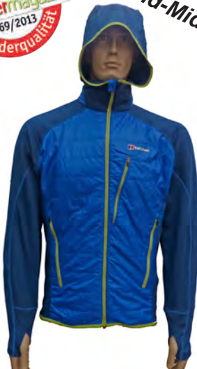
Berghaus Ignite Hybrid Hoody Jacket

Dünne Hybrid-Jacke aus PrimaLoft® mit seitlichen Stretcheinsätzen. Perfekt als wärmende Mittelschicht. Kapuze aus Stretchmaterial ist nicht einstellbar. Auch als Voll-Primaloftvariante erhältlich.