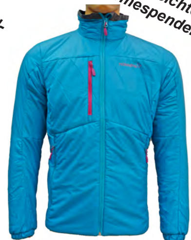
Norrna Lyngen PrimaLoft 60 Jacket

Extrem leichtgewichtige PrimaLoft® Jacke mit hohem Wärmefaktor. Hochschließender Kragen mit Microfleeceinnenfutter lässt keine Kälte eindringen. Ideal geeignet als Midlayer.