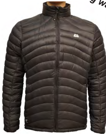
Mountain Equipment Arete Jacket

Sehr warme Daunenjacke aus 90/10er Entendaunenmix und 675er Füllkraft. Kleine Kammern sorgen für perfekte Wärmeleistung. Gute Passform, relativ hohes Gewicht.