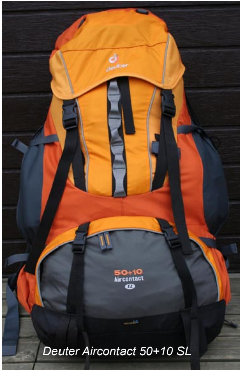
Deuter Aircontact 50+10 SL