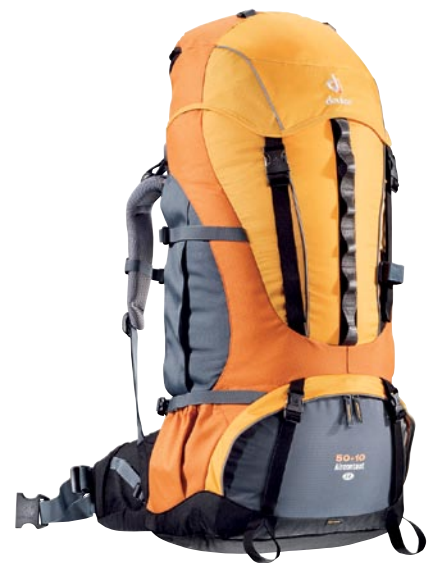
Deuter Aircontact 50+10 SL

Der Tatonka Isis 60 lässt sich - im bepackten Zustand - abstellen ohne dass er umfällt. Allerdings braucht es hierzu etwas Geduld und Fingerspitzengefühl, denn nur wenn man den richtigen Winkel erwischt, steht er tatsächlich sicher.