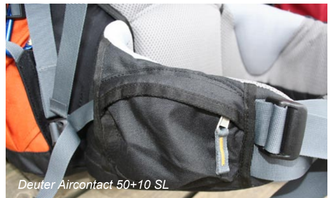
Deuter Aircontact 50+10 SL