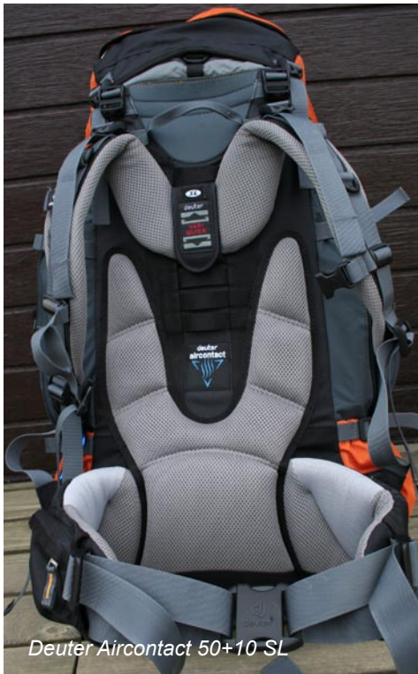
Deuter Aircontact 50+10 SL

Der Deuter Aircontact 50+10 SL ist ein speziell auf die weibliche Anatomie zugeschnittener Trekkingrucksack. Der erste Eindruck vermittelt ein überaus stabiles und trotzdem flexibles Tragesystem, mit der für Deuter typischen Robustheit und zuverlässiger, sicherer Lastenkontrolle. Das Aircontact-Tragesystem mit dem atmungsaktiven Material 3D AirMesh