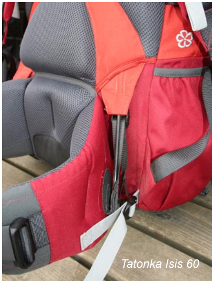
Tatonka Isis 60

Der Hüftgurt des Deuter Aircontact 50+10 SL sitzt durch die spezielle Form perfekt bei der weiblichen Rucksackträgerin und ermöglicht sehr gute Lastenkontrolle, auch in schwierigem Gelände. Bei sehr schwerem Gepäck leidet jedoch der Komfort etwas – dann drückt der Hüftgurt, was bei langen Touren durchaus schmerzhaft sein kann. Die schmalen Schultergurte sind auch eher für schmale Frauen gemacht – dann passen sie sich aber perfekt an und bieten bequemen Tragekomfort.