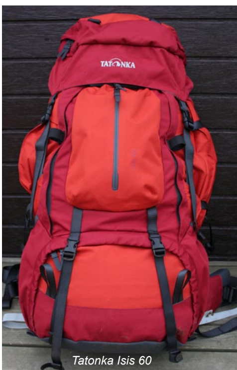
Tatonka Isis 60

Gewicht: 2450 g Ladenpreis: 169.95 € Herstellerinfos: www.deuter.com