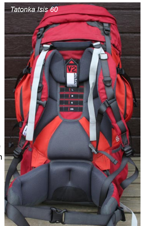
Tatonka Isis 60

Die Schultergurte des Tatonka Isis 60 sind speziell für Frauen zugeschnitten, einfach einzustellen und auch in aufgesetztem Zustand gut erreichbar. Der Hüftgurt ist etwas schwergängig, nach Gewöhnung aber unproblematisch. Die Lastenkontrollriemen auf der Schulter können auch beim Tragen angezogen werden. Die Rückenlänge des Isis 60 ist einfach zu verstellen, die Abstände sind von XS bis XL gekennzeichnet und wurden von mehreren Prüfpersonen als nachvollziehbar und gut einstellbar empfunden.